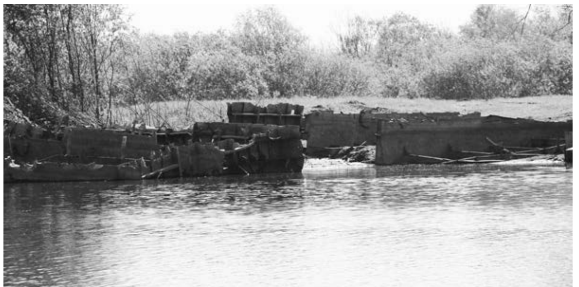
Освобожденное от остатков баржи русло р. Чаус.

Мало сделано по благоустройству как в самой Колывани, так и в селах МО. Очень слабо у нас развита сеть тротуарного хозяйства. Считаю, каждый