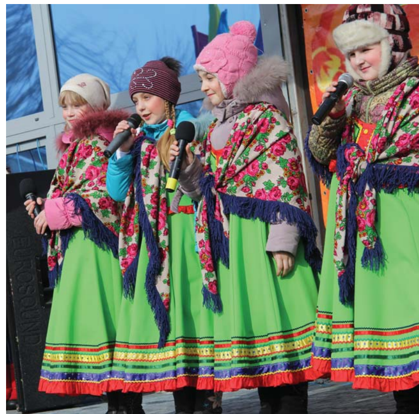
Дебют вокального коллектива «Забавы».