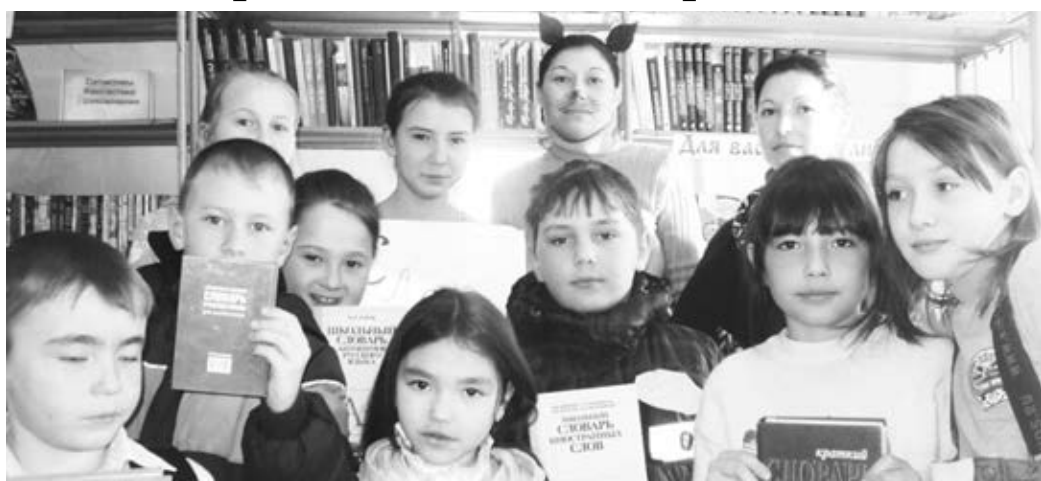
Участники путешествия вместе с героями.

Ватага ребятшек с мороза ввалилась в библиотеку. Краснощечие, веселые, с любопытными глазами. Несмотря на холодную погоду, первоклассники пришли в библиотеку.