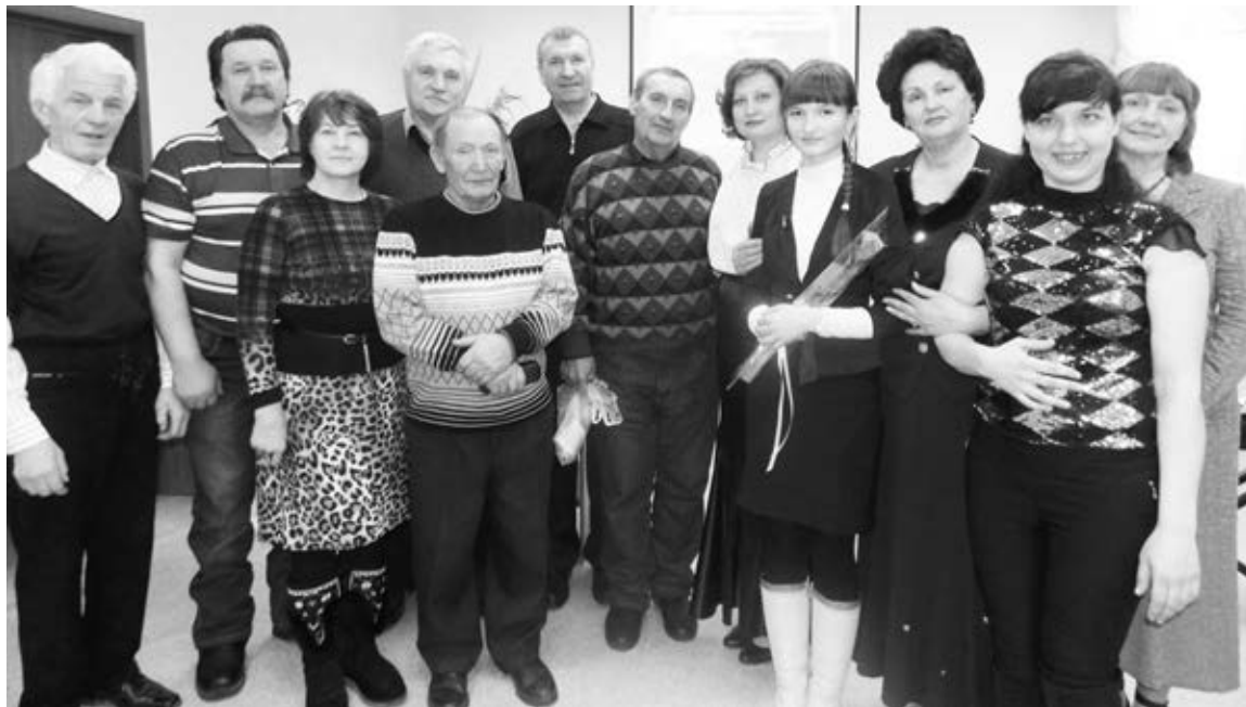
«Родниковцы» отмечают день рождения.

единение пришли представители общественных организаций.