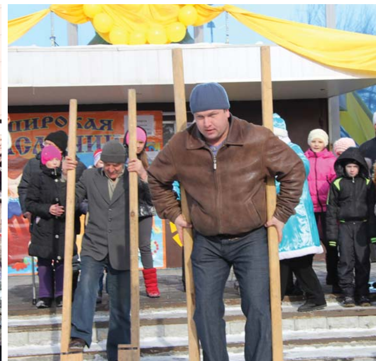
Танцы на ходулях.