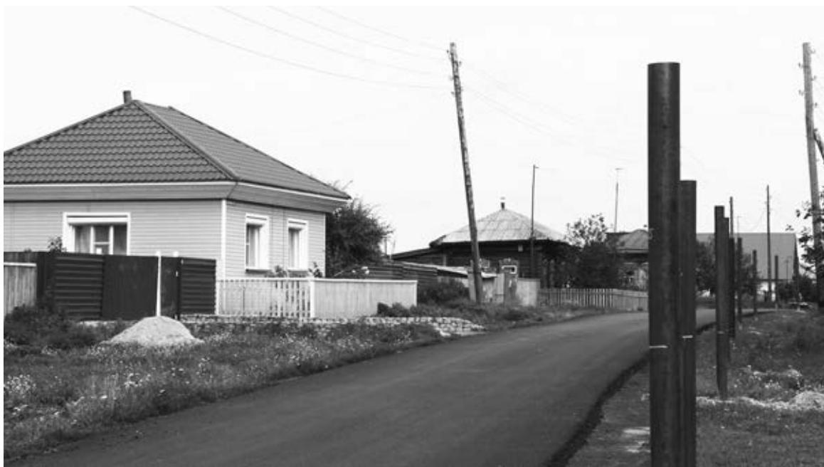
Отремонтированная дорога в с. Чаус (август 2013 год).

В свою очередь искренне благодарю всех, кто помогал мне в работе, давал дельные советы, разумно критиковал за недостатки, способствовал улучшению жизни колыванцев.