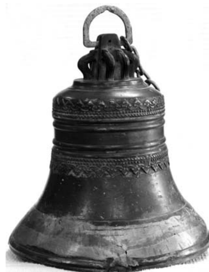
Новосибирске на празднике колокольного звона.

Сибирский центр колокольного искусства объявил конкурс «Найди свой колокол», цель которого - выявление информации о колокольном наследии и поддержка активистов-поисковиков. По открывшимся в процессе поисковой работы фактам, возможно, будут организованы экспедиции. Победители (первый приз - планшет) будут награждены 27 апреля в