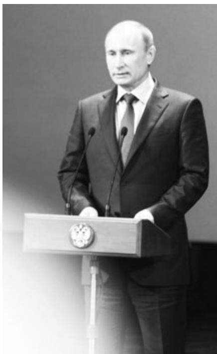
ПРЕЗИДЕНТ РФ В. В. ПУТИН.

Дорогие друзья! Александр Иванович Покрышкин был настоящим гением лётного боя. В истории мировой авиации он признан и как бес-