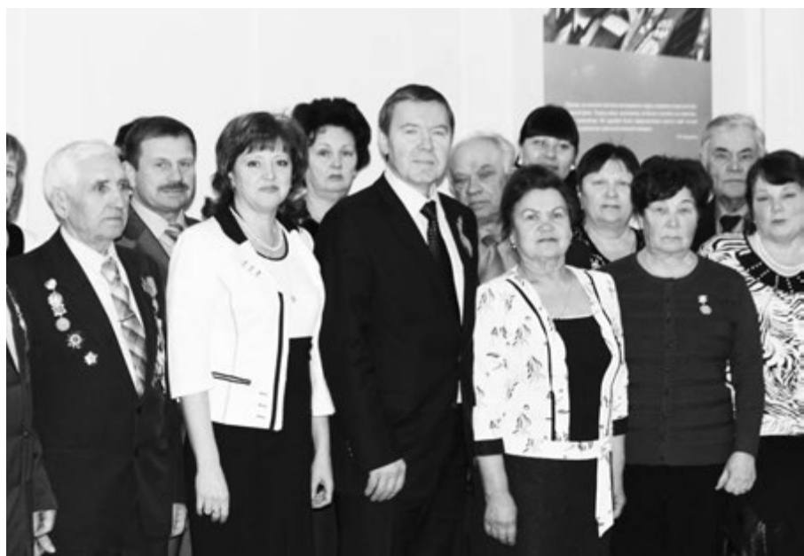
ДЕЛЕГАЦИЯ КОЛЫВАНСКОГО РАЙОНА.

Добавим, что в ходе торжественного собрания зрителям была представлена праздничная программа «В небе Покрышкин...». На сцене выступили коллективы театра оперы и балета, «Первого театра», театра Музыкальной комедии, театра Афанасьева и «Красного факела». В основу праздничной программы легла биография героя, в концертных номерах были задействованы раритетные автомобили