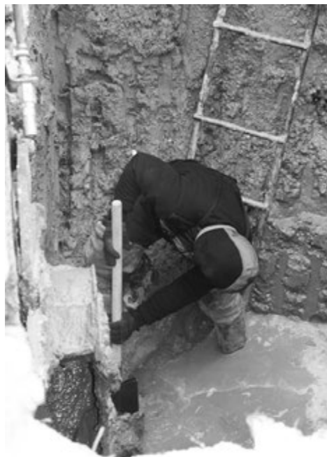
В ТАКИХ УСЛОВИЯХ ПРИХОДИТСЯ РАБОТАТЬ СЛЕСАРИМ.

клиентов, им приходится решать, связываясь с теми же МУП «ЖКХ», ООО «СибТЭК» и другими поставщиками услуг коммунального хозяйства. Во главе этих организаций стоят грамотные руководители, которые прошли многолетнюю школу ведения коммунального хозяйства.