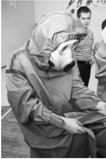
СРЕДСТВА ХИМИЧЕСКОЙ ЗАЩИТЫ.

В целях воспитания патриотического духа молодого поко-