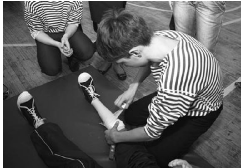
ОКАЗАНИЕ ПЕРВОЙ МЕДИЦИНСКОЙ ПОМОЩИ.

Школьной библиотекой во время декады была проделана также весомая работа. Проводились конкурсно-игровые программы «Тропа к генералу» для учащихся начальных классов.