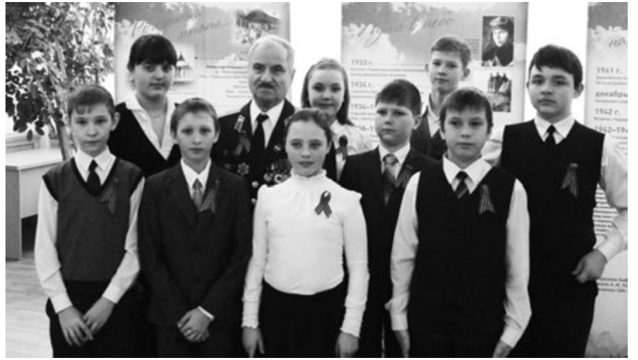
УЧАЩИЕСЯ КСШ № 3.

В заключение был продемонстрирован документальный фильм о великом летчике, из которого ребята почерпнули многое, а главное – как важно любить край, в котором ты живешь, и быть его защитником.