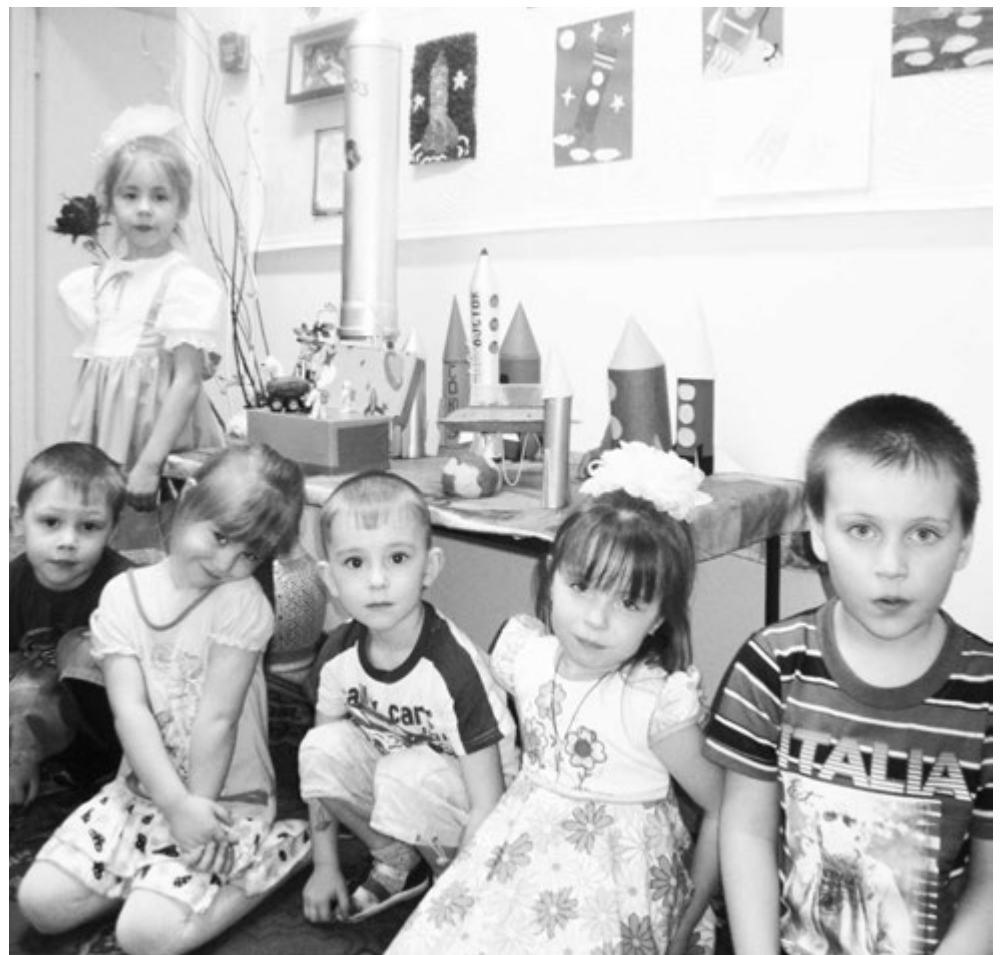
РЕБЯТА ВОЗЛЕ ВЫСТАВКИ ПОДЕЛОК.

А завершила данное мероприятие «Космическая дискотека», на которой дети от души повеселились в огнях цветомузыки.