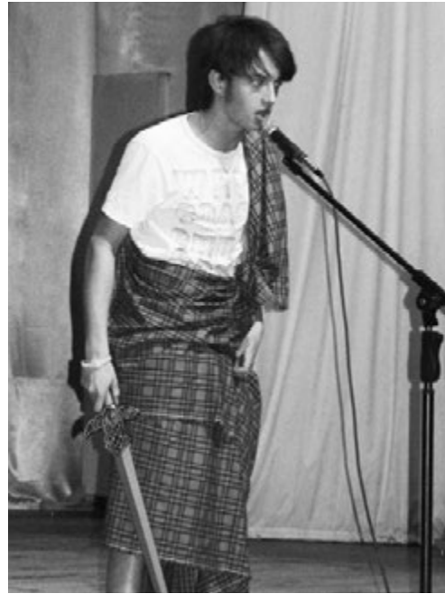
УЧАСТНИК КОМАНДЫ «НЕ ПО ГОСТУ».

Первого апреля отмечается «День смеха». Этот день не внесен ни в один календарь знаменательных и праздничных дат, но его вполне можно отнести к международным, поскольку обычаем веселиться и шутить именно первого апреля существует в очень многих странах. По традиции в этот день принято подшучивать над друзьями, членами семьи, коллегами. Но всё чаще в эту дату проводят различные Юморины, веселые фестивали и праздники.