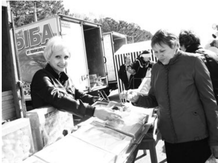
ДЕГУСТАЦИЯ КОНДИТЕРСКИХ ИЗДЕЛИЙ.