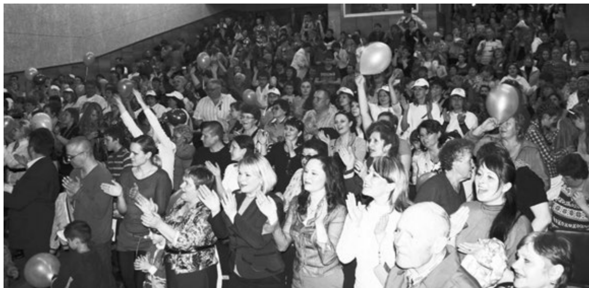
РУКОПЛЕЩЕТ ВОСХИЩЕННЫЙ ЗАЛ.

нивало манеру исполнения, внешний вид, умение держаться на сцене.