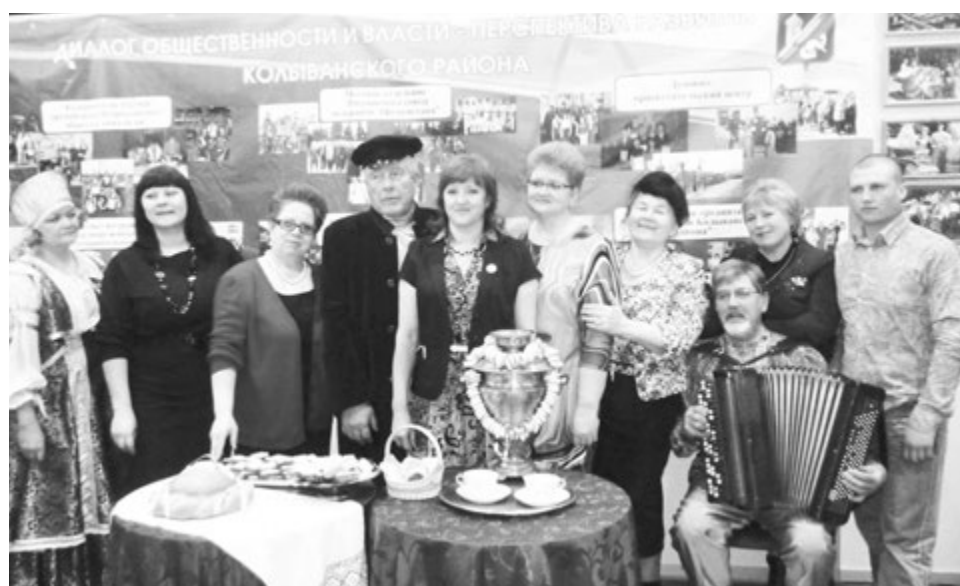
ДЕЛЕГАЦИЯ КОЛЫВАНСКОГО РАЙОНА.

Колыванские активисты домой вернулись «с полными мешками идей» и во-