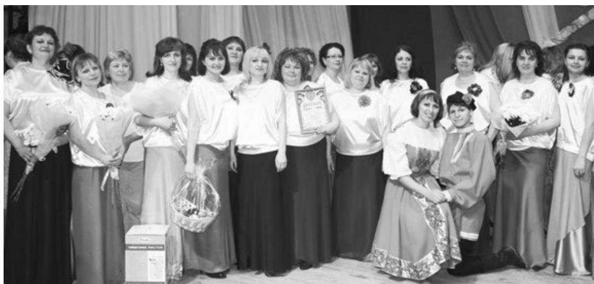
ПОБЕДИТЕЛИ - СВОДНЫЙ ХОР ДЕТСКИХ ДОШКОЛЬНЫХ УЧРЕЖДЕНИЙ.

Конкурсанты старались вовсю не только показать свои