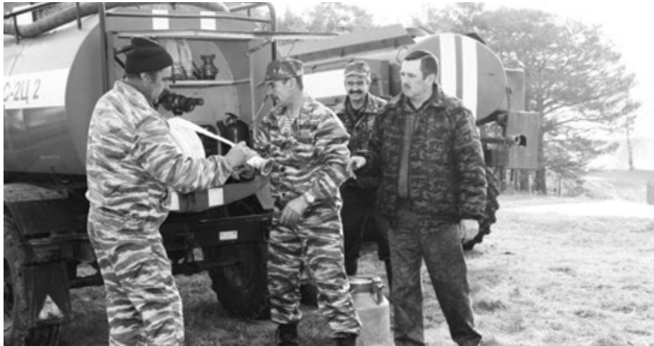
ПОЖАРНАЯ ДРУЖИНА ДЕМОНИСТРИРУЕТ РАБОТУ ПОЖАРНОЙ ПОМПЫ.