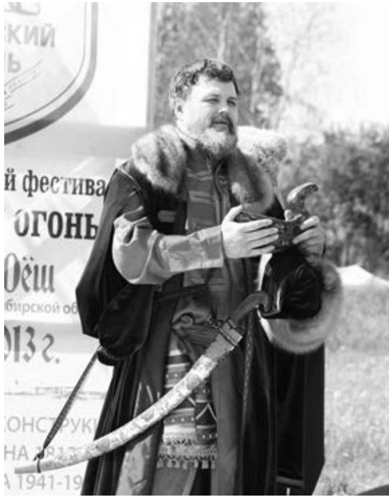
Ермак напутствует казаков.