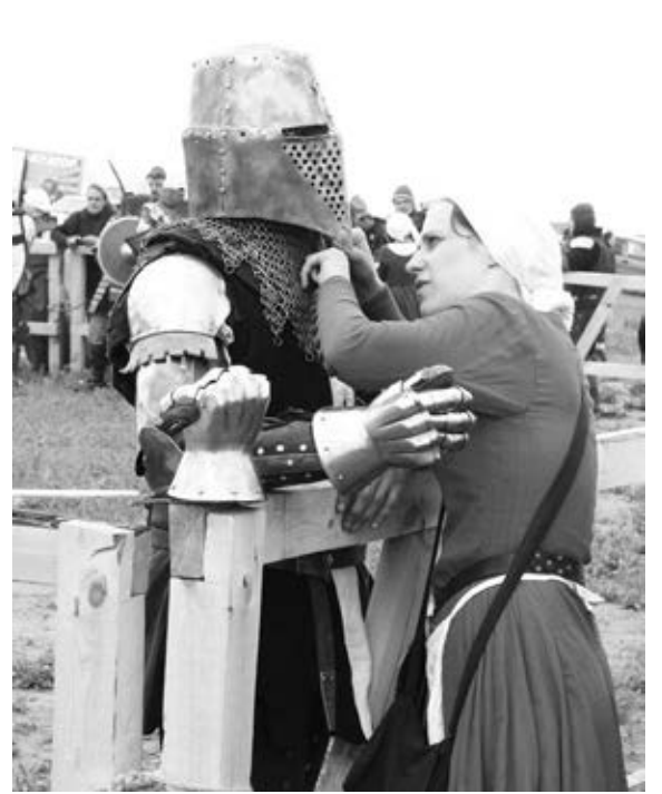
Прекрасная дама провожает рыцаря в бой.

400 участников из 30 городов России и ближнего зарубежья, шесть эпох, около 10 тысяч зрителей.