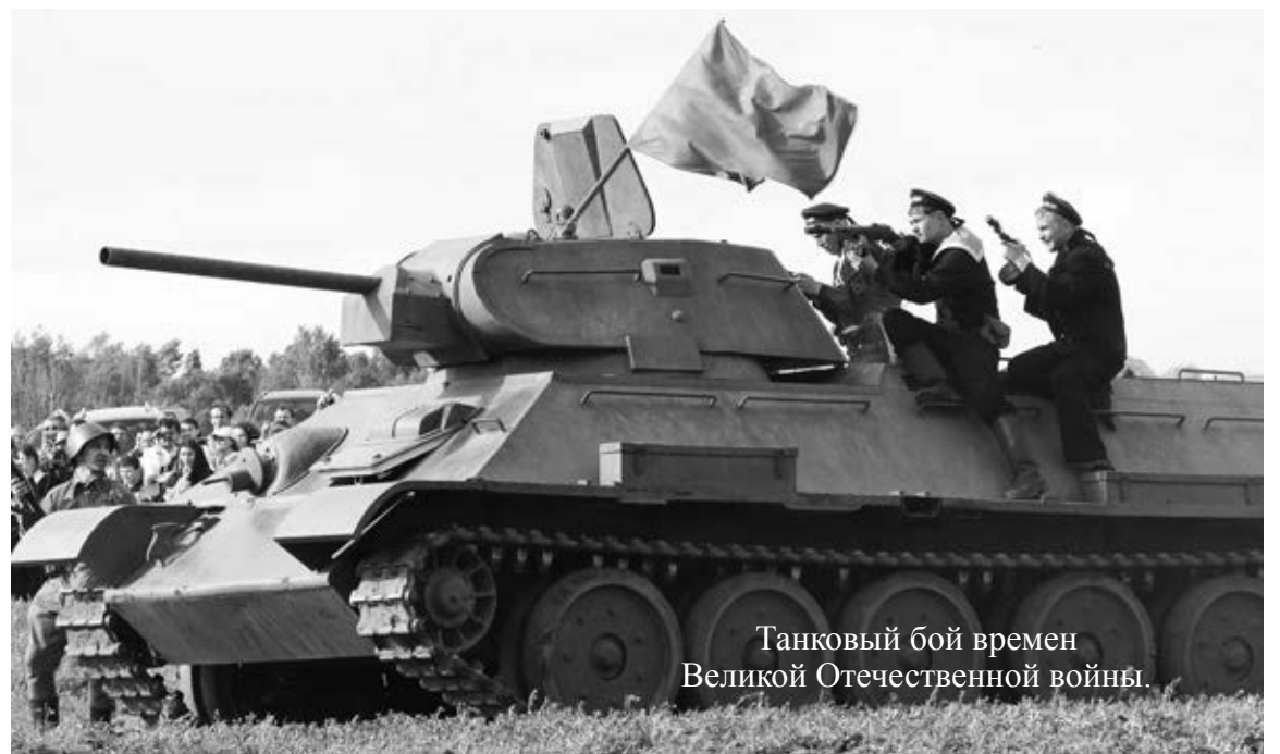
Танковый бой времен Великой Отечественной войны.