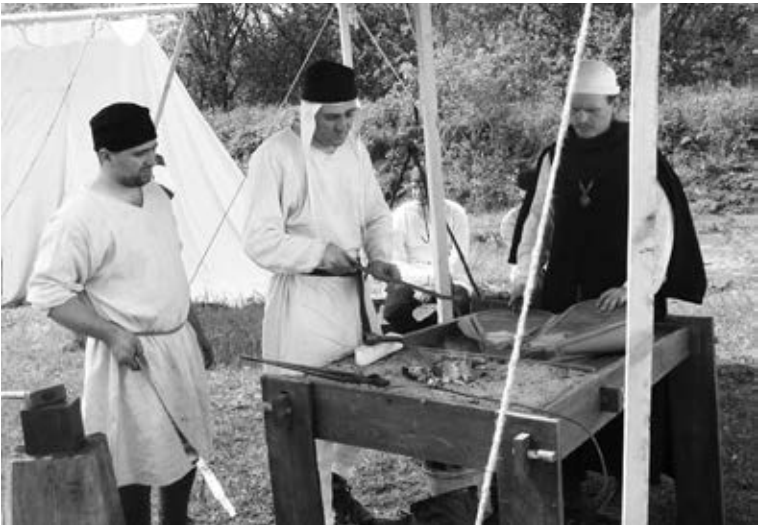
В кузнечной мастерской.