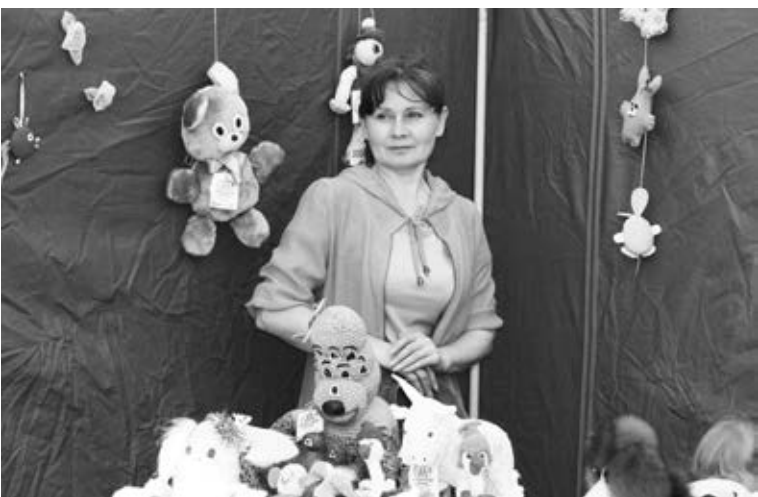
«Ярмарка мастеров» встречала гостей.