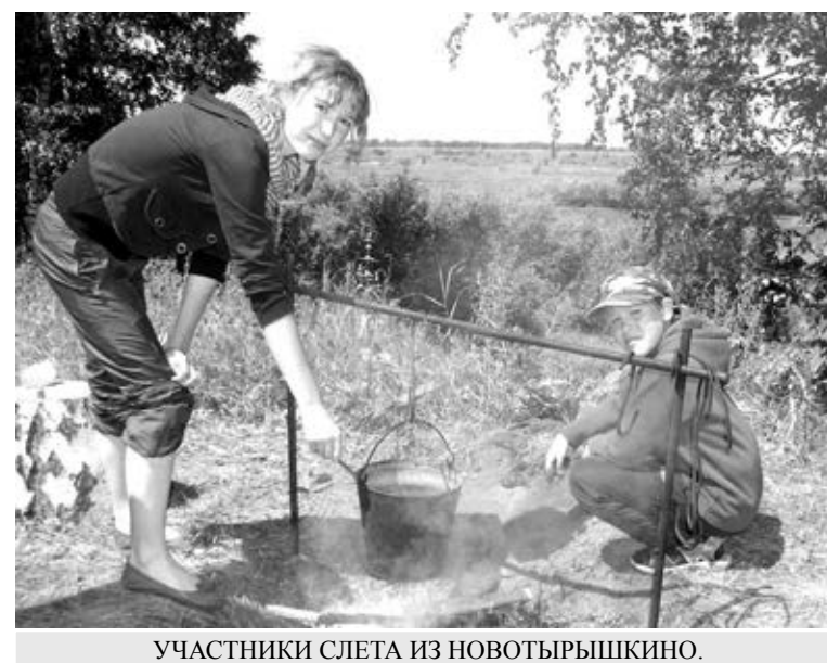
УЧАСТНИКИ СЛЁТА ИЗ НОВОТЫРЫШКИНО.