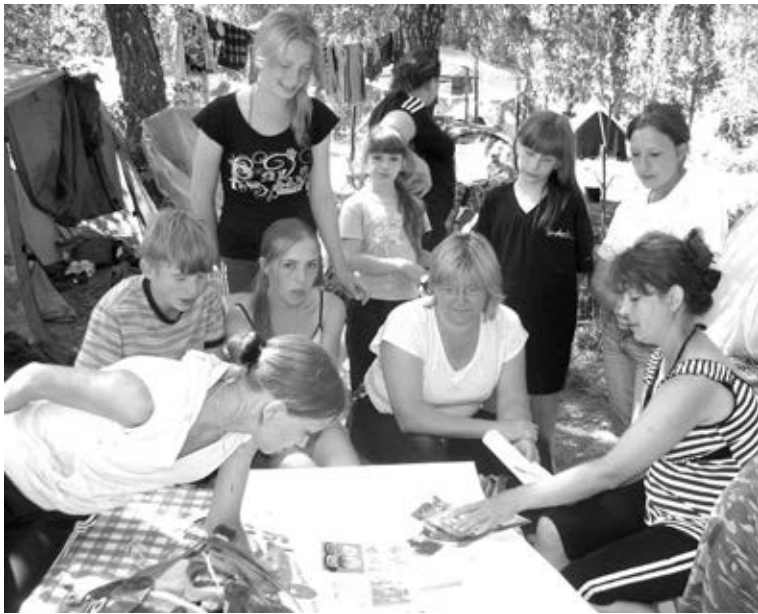
ВЬЮНЦЫ РАБОТАЮТ НАД ГАЗЕТОЙ.

ний Кольванского района представили свои команды, у КСОШ № 2 их было две: одна состояла из бывалых туристов, вторая - из новичков.