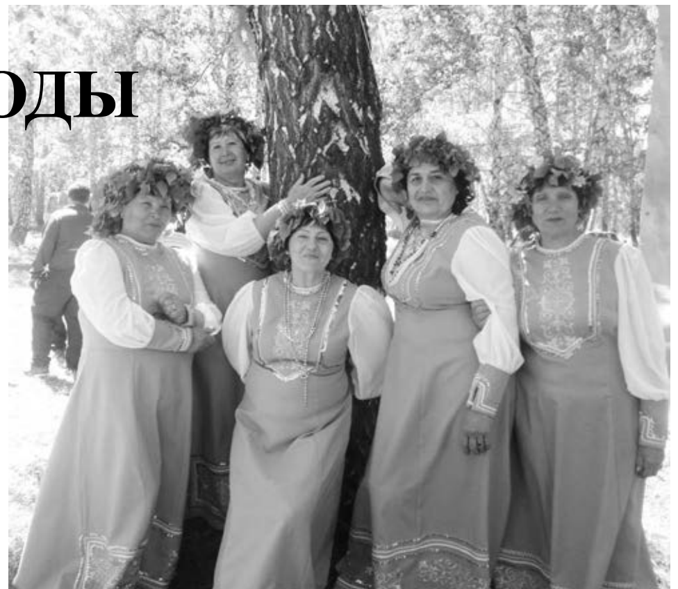
Артисты возле березки-именинницы.

манды футболистов, богатырей, соколовских и вьюнских ребят, состязавшихся в силе, ловкости, находчивости, среди которых выбирали и «идеального мужчину» в конкурсе «Как хотела меня мать». Все участники праздника получили памятные призы, а затем началась дискотека с «живой музыкой».