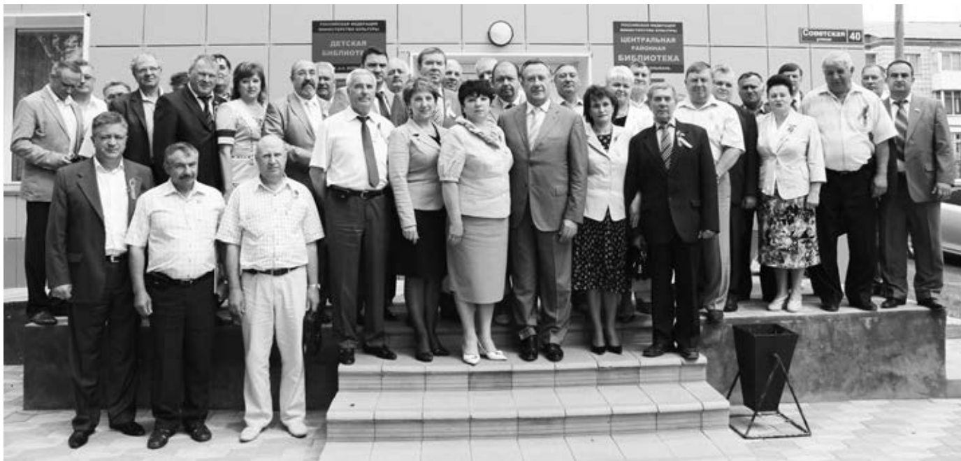
Участники выездного заседания.

28 июня в Колывани прошло выездное заседание Совета по взаимодействию Законодательного Собрания Новосибирской области с представительными органами муниципальных районов и городских округов.