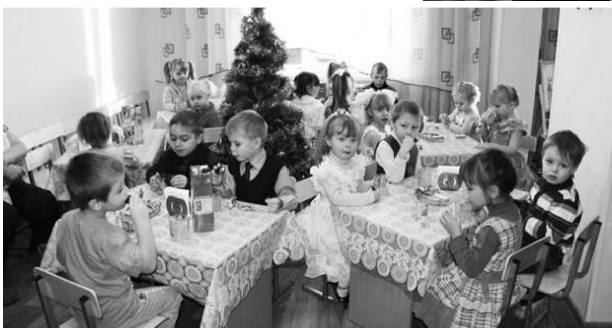
ЧАЕПИТИЕ В ДЕТСКОМ САДУ «РАДУГА», МИКРОРАЙОН ВОСТОЧНЫЙ.

- Губернатор нашей области всегда говорит о планах и требует, чтобы до завершения года они реализовывались. Так, в уходящем году Правительством области совместно с главами муниципальных образований районов было запланировано ввести более восьми тысяч дошкольных мест по Новосибирской области. И я могу сказать: этот план полностью выполнен. Программа создания дополнительных мест про-