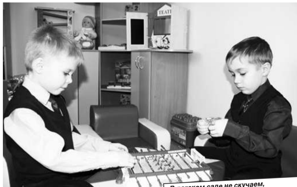
В детском саду не скучаем, В игры с другом мы играем.