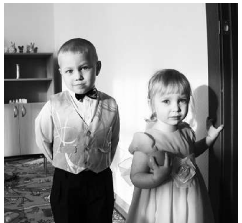
ВОСПИТАННИКИ ДЕТСКОГО САДА «СКАЗКА» С. СОКОЛОВО.

- Мы были безумно счастливы, когда узнали, что идём в детский сад. И даже не ожидали, что он будет настолько красивым. Здесь царит тёплая, добрая обстановка, есть всё необходимое для малышек. Мы с радостью заправляли постель-