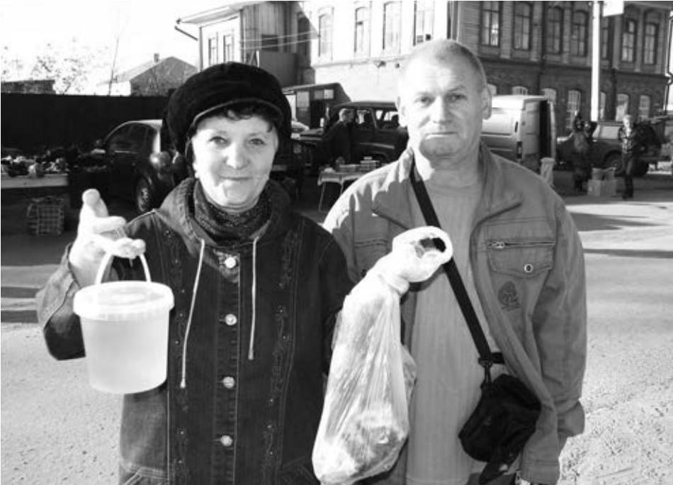
МЫ НА ЯРМАРКУ ПРИШЛИ И ТОВАР СЕБЕ НАШЛИ.