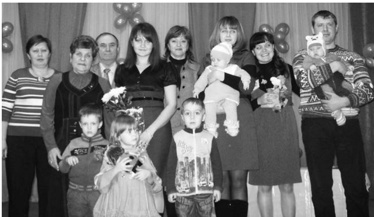
УЧАСТНИКИ ПРАЗДНИКА МАМ.

Социальный педагог КЦСОН Колыванского района.