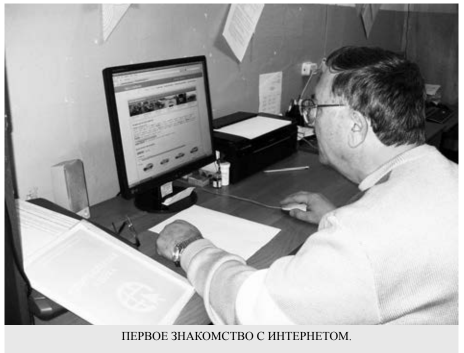
ПЕРВОЕ ЗНАКОМСТВО С ИНТЕРНЕТОМ.